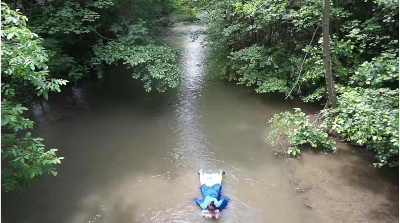
Rizikó videó sorozat, 2018, részlet

„Élő és az élettelen tárgyi valóság viszonya keveredik, olvad egymásba, mint ahogy a számunkra is a múltból ismerős hiedelemrendszerekben olyan gyakran váltak cselekvővé a tárgykultúra kitüntetett darabjai (repülőszőnyegek, csodalámák, a hétmérföldes csizma, a kő a levesben) vagy épp a természet képződményei (folyók, tavak, fák, füvek és az égig érő hegységek).” 9 – írja Salamon. Fragmentált világlátásunk felmutatásának egy kézenfekvő médiumának látom a kollázs típusú gondolkodás, építkezést. A kollázsok rendszertelen rendszerében az arányok folyékonyvá válnak, és folyamatosan elmozdulnak, töredezettségre épít. Egymás mellé kerülhetnek össze nem illő dolgok és egyenértékűvé válhatnak egymástól térben és időben amúgy elkülönülő elemek, ez a töredezettség a mellékhatása annak, ahogyan élünk, ahogyan beavatkozunk a természetbe, és próbáljuk elkerülni a véletlent, mind három kiállításban próbáltam a térben is megvalósítani e kollázs logikát. „A kerámia egyszerre archaikus és futurisztikus anyag, egyidős az emberi civilizációval, olyan elemi keverék, amely (messze az írásbeliség megjelenése előtti időkre visszanyúlva) évezredek óta kísérője, felülete a kultúrának...a művész az archeológus, a tudós szerepébe bújlik, ahol a feltárás, a nyomkeresés vagy -biztosítás, a töredékek összeillesztése lesz az alkotás, a befogadás egyik markáns szervezőelve.” 10 – írja Salamon Júlia a Porolás a rongyszőnyegen című írásában: Mind a Melléktermék c. kiállításban, mind a