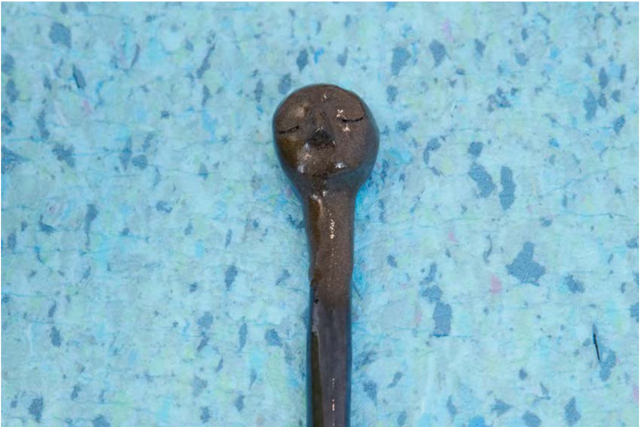
Delta Sleep, Fekete agyag, Mázas kerámia, 2017.

A nézőben értelmes képpé áll össze, mint a pillanatragasztóval összeillesztett porcelán, ami nevetségessé válik a porcelán nemessége és a pillanatragasztó alantasságának találkozására.