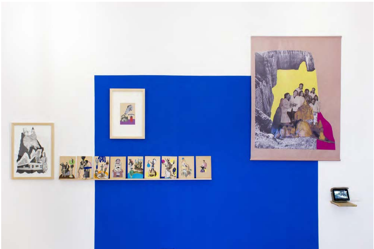
Melléktermék kiállítás, Bizonytalansági elv, 2018.

E három kiállításon és a két akción keresztül készítettem el és mutattam be azokat a munkáimat melyeken a melléktermék gondolatával foglalkozva dolgoztam. Elrontott szituációkat gyűjtöttem össze, és a szerencsés emberi döntés helyzeteket is mint például amikor valaki egy törött széket házilag javít meg és a törött láb helyett, gányolva egy botot helyez be, vagy valaki befőttes gumival javítja meg elromlott slicc cipzárját.