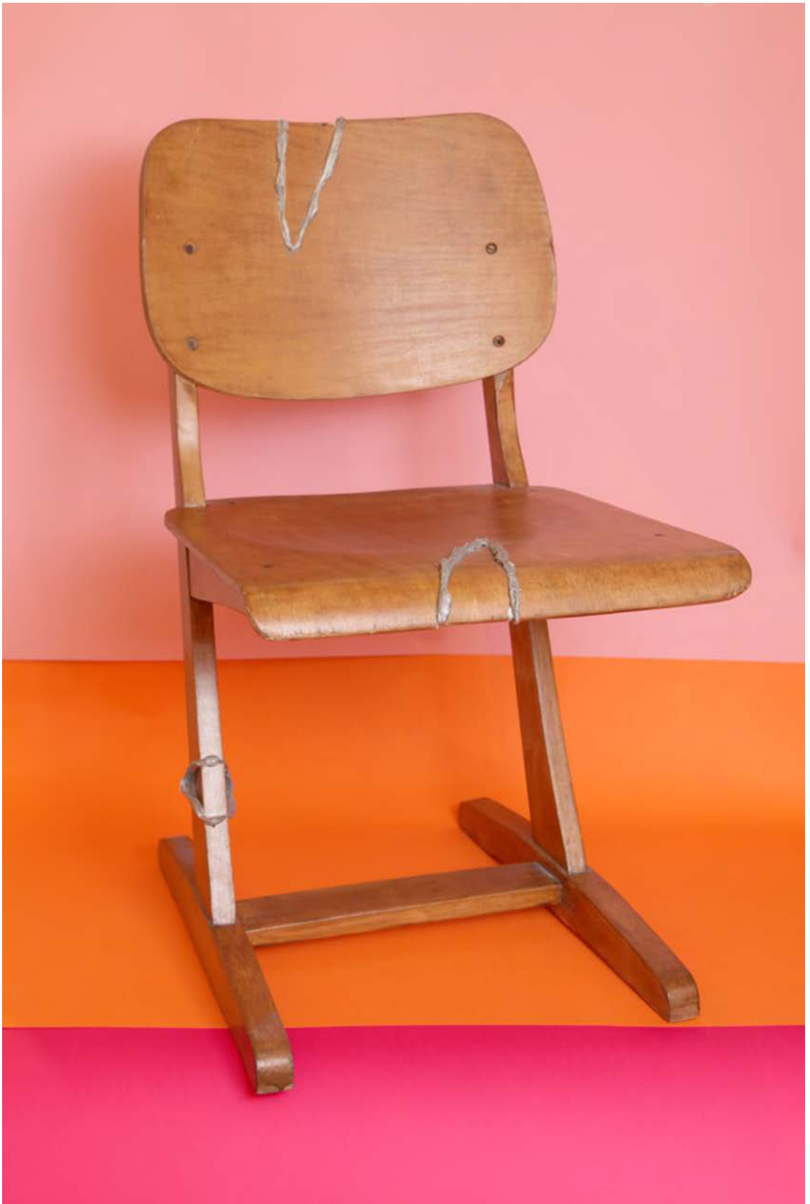
Javított tárgyak, 2017, A töredezettségmentesítés egy örökkévalóság lesz, SZIKM