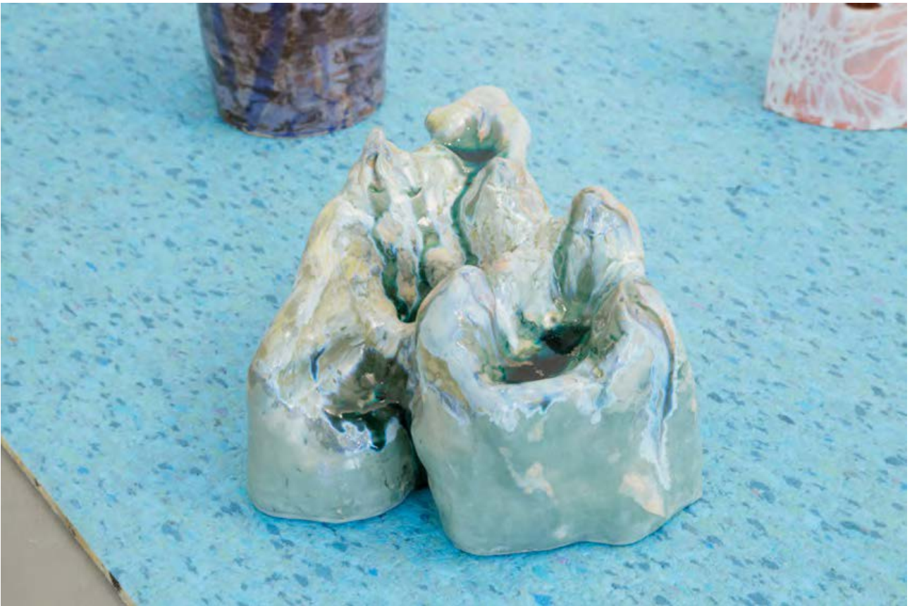
Athos, Etna, Hara Berezaiti, Ida, Kailash, Koya-San, Meru, Othyris, Olympus, Sinai, Taranaki... Mázas kerámia, 2017.