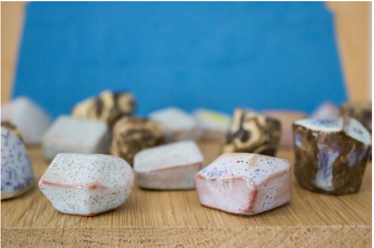
Melléktermék kiállítás, 2018