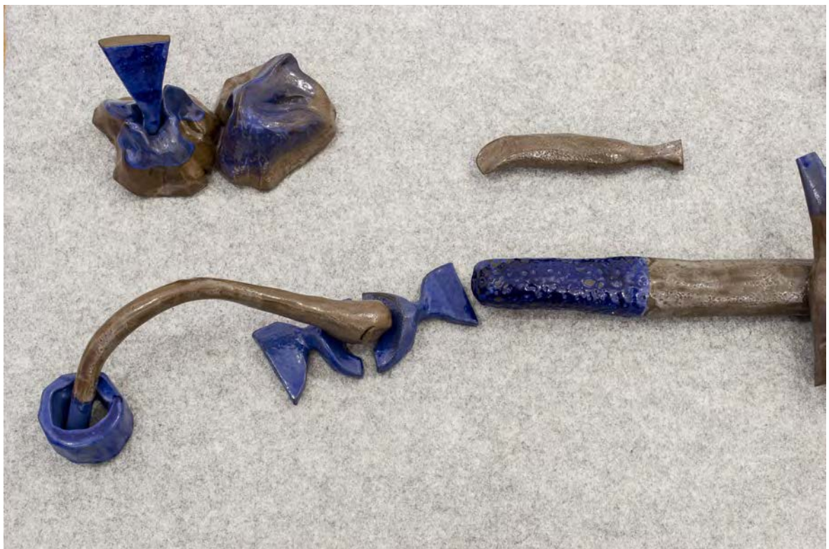
Javított leletek. Mázas kerámia, fekete agyag, 2018.

A nézőben értelmes képpé áll össze, mint a pillanatragasztóval összeillesztett porcelán, ami nevetségessé válik a porcelán nemessége és a pillanatragasztó alantasságának találkozására.